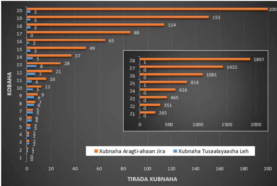
Shaxan 1: Tirakoobka xubnaha maansada Soomaaliyeed.

Xubnaha midabka huruudda ah ku muujisan ee Shaxan 1 waa xubnaha aragti ahaan (ugu yaraan) jira ee maansada. Marka aan raadinno wadarta tirada xubnahan waxa aan helaynaa 7735. Sida keli ah ee ay xubnahani tiro ahaan ku sii badan karaan waa iyada oo ay tirada kobohu biirsanto. Dhanka kale, xubnaha aan tusaalayaashooda haysanno, ee ku muujisan midabka lafcirka ah, waxa ay tiradoodu tahay 74. Mar kasta oo la curiyo/helo tusaale hor leh waxaa kordhaysa tirada xubnahan. Sidaas awgeed, Shaxan 1 sidiisaas waligiis ma ahaanayo, oo diillimaha lafcirka ah ayaa kordhaya tiro ahaan—illaa ay la sinmayaan diillimaha huruudda ah.