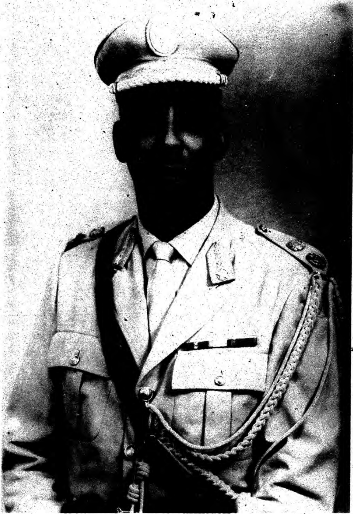
Jaalle Maj. General MAXAMMED SIYAAD BARRE