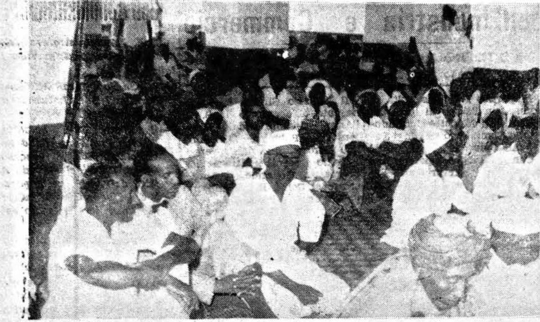
Autorità e Popolo in preghiera alla Moschea Scek Abdulcar.

Annunciato dai tradizionali colpi di cannone, a cui hanno fatto eco centinaia e centinaia di «botti», più o meno forti, accolto da un applauso giubilante, dallo sventolio delle bandiere e dall'accendersi di migliaia di lampadine multicolori su tutti gli edifici pubblici, ed anche non, della città, l'Id El Fitr del 1960 è iniziato lunedì sera.