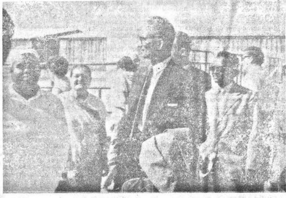
Il Direttore Generale dell'Unesco subito dopo il suo arrivo