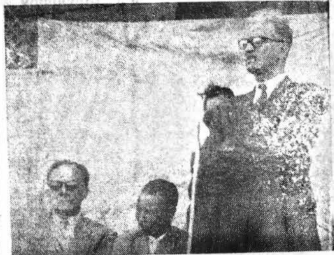
Parla il Vice Direttore Generale dell'UNESCO

solo un'apparenza fallace, che può far cadere in errore solo il viaggiatore occasionale.