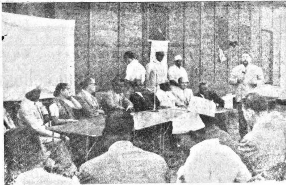
Le Autorità presenti ieri a Villabruzzi