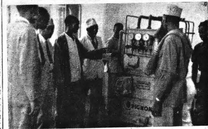
Davanti ad un distillatore

perdistillata per usi medici o particolari, lo zuccherificio col suo complesso macchinario e col suo ciclo produttivo completo, per cui seguendone le fasi si può vedere entrare la canna — scaricata dai trenini — per arrivare ai sacchi di zucchero che belli e chiusi e pesanti scendono per uno scivolo nei magazzini dove enormi autotreni li caricano per distribuirli in tutta la Somalia. E' una cosa complessa ma lì, a seguire le varie fasi, della lavorazione della canna, di cui niente va gettato, sembra proprio che lo zucchero venga fuori così: come per un colpo di bacchetta magica. E pure a pensarci bene quanto sudore, quanto lavoro, quanti anni di studio, di ricerche, di perfezionamenti, ha impiegato l'umanità per permetterci stando tranquillamente seduti in una poltrona di versare il cucchiaino di zucchero nella tazza del caffè o del «chai».