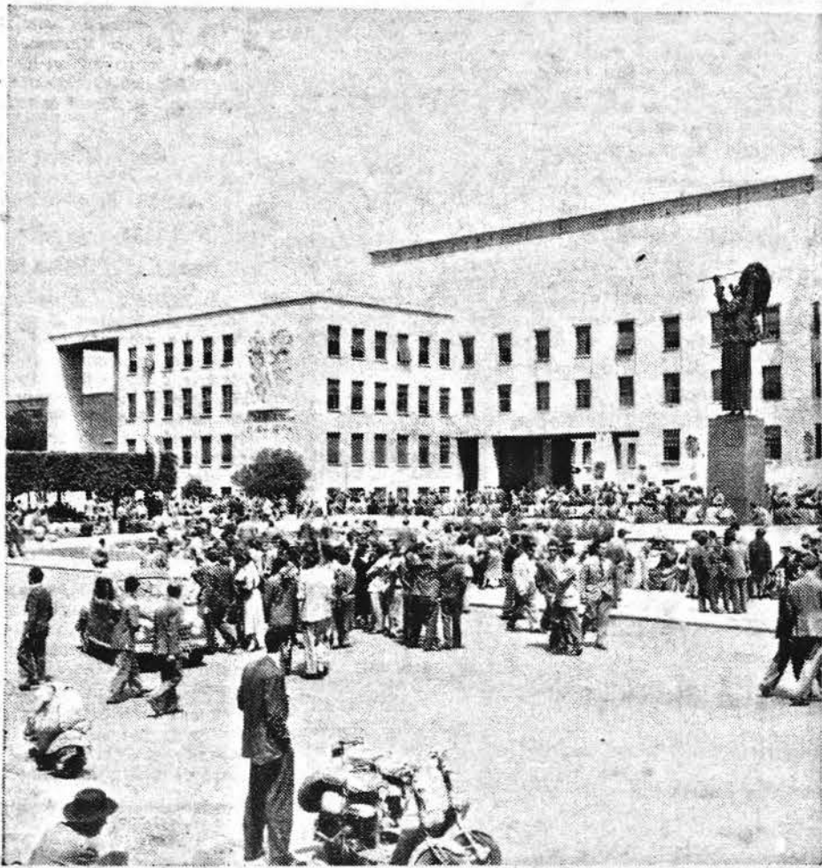
ميدان «مينيرفا» أي الالهة الحرب لجامعة روما