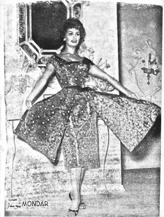
La bellissima stella del cinema italiano, che si è trasferita negli Stati Uniti dove per qualche anno lavorerà per la produzione di Hollywood con sé una ampissima collezione di vestiti confezionati appositamente dalle gran-

di case italiane. Ecco Sofia Loren che mostra alcuni dei più interessanti modelli del suo guardaroba, altamente ammirato in America per la ricchezza e per l'eleganza delle linee, dei colori e dello stile.