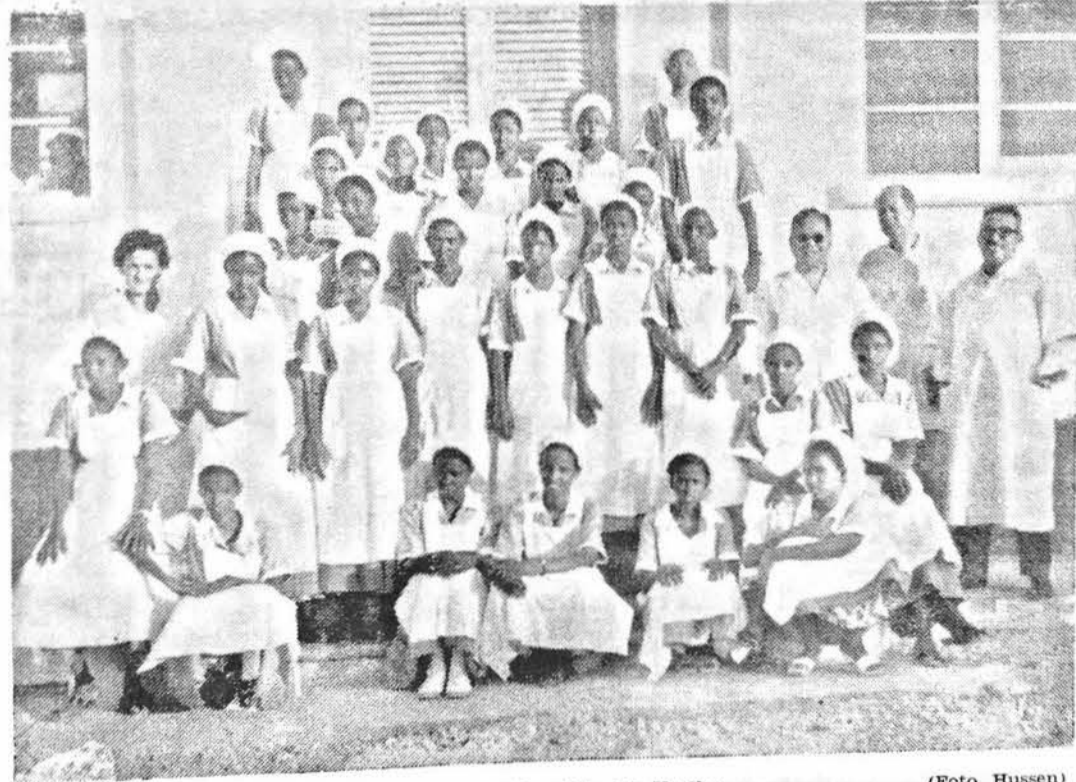
Le infermiere dell'Ospedale De Martino

L'anno decorso è stato un periodo di studio e di preparazione per l'organizzazione del Dipartimento del Lavoro il quale rappresenta nella vita politica economica e sociale dei Paesi moderni in genere, e della Somalia in particolare, un organo di fondamentale importanza, dato che il lavoro è la principalissima fonte di vita per la quasi totalità dei Somali. Tale attività di studio si è protratta per molti mesi a causa della complessità dei problemi, del tutto nuovi, che sorgevano dalla necessità di disciplinare le questioni del lavoro, soprattutto dal punto di vista legislativo, allo scopo di assicurare la continuità del processo produttivo e il benessere della classe lavoratrice.