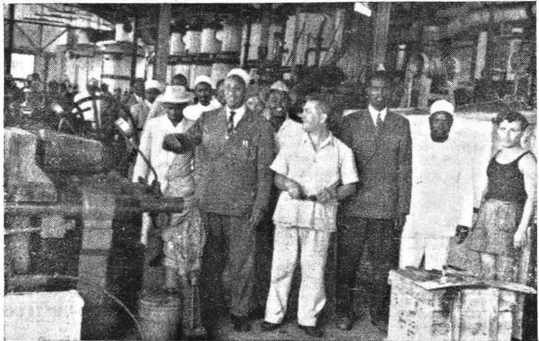
La visita allo zuccherificio