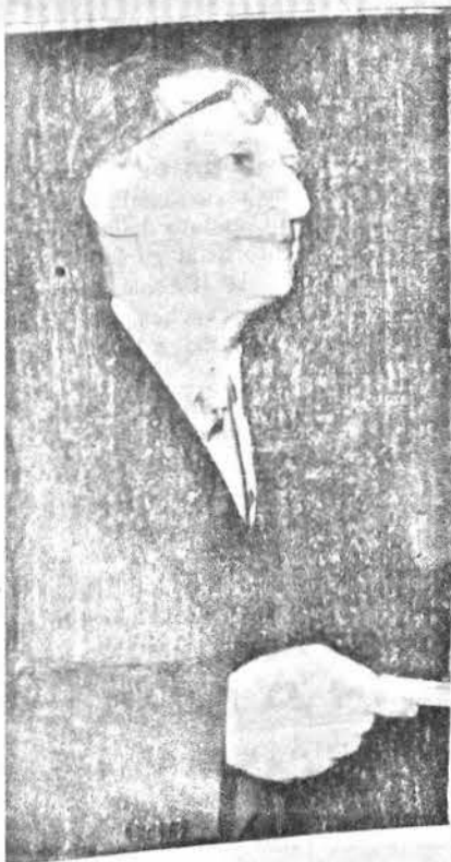
Il Presidente del Consiglio On. Alcide De Gasperi, attualmente negli Stati Uniti dove partecipa alle riunioni del Consiglio Atlantico