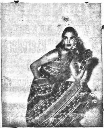
Simpatico vestito per giardino dall'intonazione zingaresca.

Se la colazione a bordo è pronta, indossate invece la gonna bianca con corpi scollato bleu, completato da un gran collettone quadrato e guarnito con righine bleu; sotto il collettone passa una lunga cravatta a righe bianche bleu, che fissate alla cintura arriva fin quasi alla gonna. Un piccolo bolero, foderato di bianco, e con i risvolti alle maniche bian-