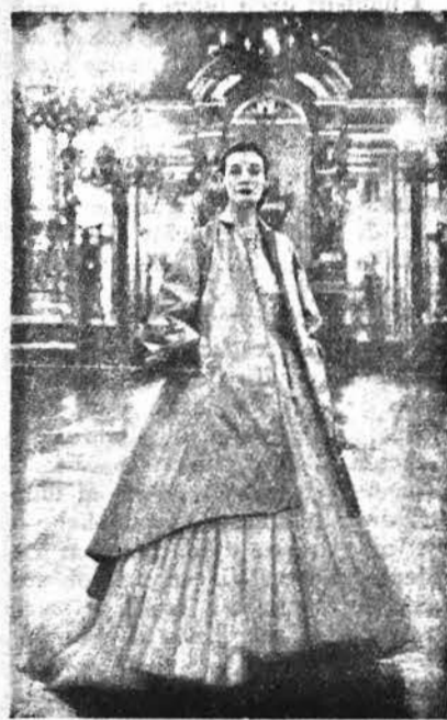
L'ampia gonna in voile bianco è la caratteristica di questo abito. Il mantello è in velluto rosso.

Gli abiti chèmisièr sono meno in voga. Gli abiti da sera so-